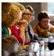
en passant par des partenariats conséquents