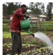
jusqu'au coaching d'entrepreneurs dans les pays du Sud