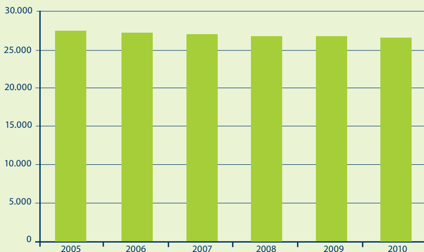
Grafiek 1 Evolutie aantal coöperatieve vennootschappen (in normale juridische toestand) in België